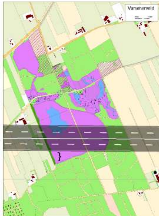
Tracé vierbaans snelweg.